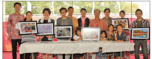
モナスでの表彰式で、記念撮影する選考者と入賞者ら

9月1~8日に開かれた第5回ジャカルタ日本祭り(JJM)で、じゃかるた新聞はJJM実行委員会と共催し、写真展(協賛エプソン・インドネシア、パナソニック・ゴーベル・インドネシア、協力・プラザ・スナヤン、ジャパン・インドネシア・フォトグラフィ)を開催した。在留邦人による「素晴らしきインドネシア」とインドネシア人が日本で撮った「素晴らしき日本」の2部門で力作がそろい、フィナーレの会場では、大使賞、実行委員長賞などの表彰式を実施した。写真展はJJM内の企画として毎年開催しており、来年以降も継続していく方針だ。